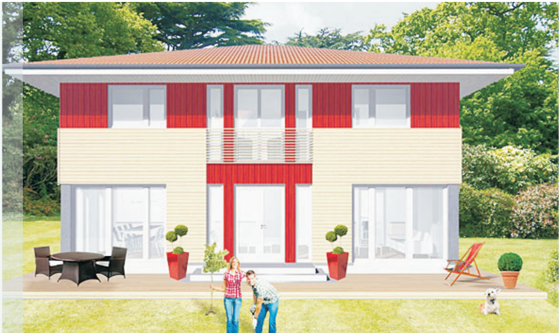
Die Abbildungen können Sonderausstattungen enthalten!